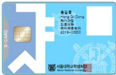
< 앞 면 >